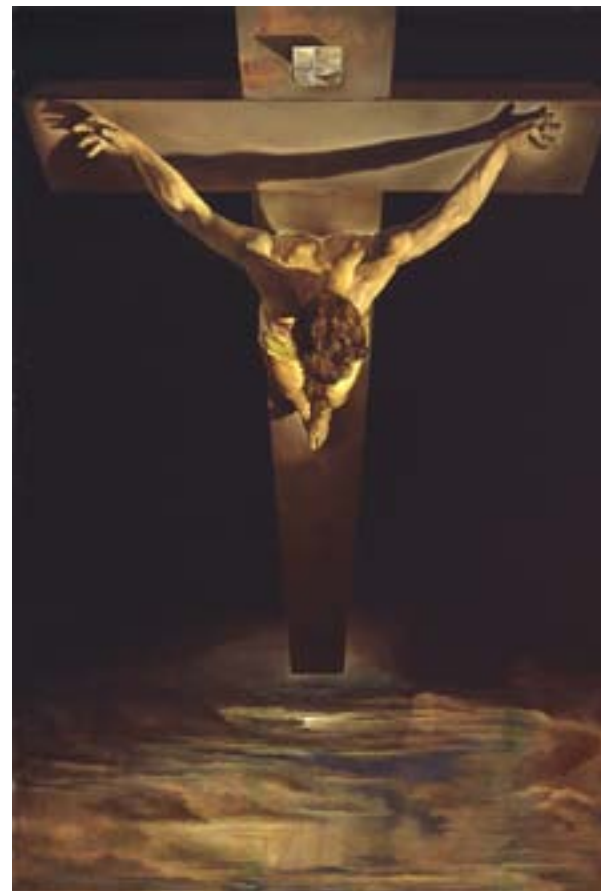
'Cristo de San Juan de la Cruz', Salvador Dalí, 1951

Arketyper på Den weltschmerzliche Munk finder vi i Jesus på korset. Lig videnskabsmanden og munken fornægter Jesus sin væren i kraft af