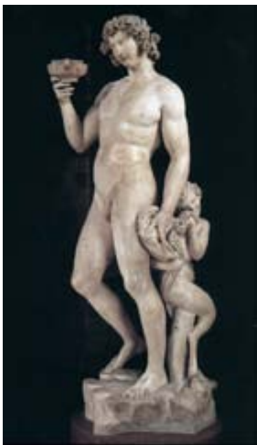
Bacchus', Michelangelo, 1497

den viser sig yderst ufarbar. Begge modi må indfanges i systemet for at give et adækvat udtryk for, hvad Weltschmerz indebærer.