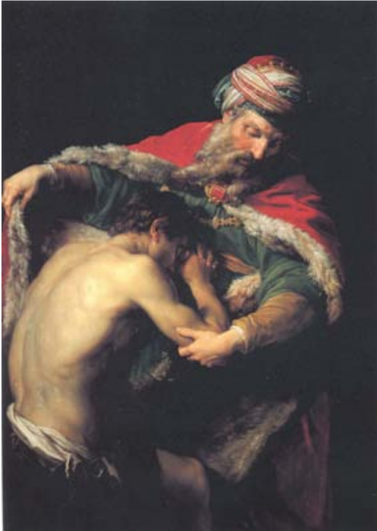
The Return of the Prodigal Son', Pompeo Batoni, 1773

man bevidst om, at Kunstnerens værensfornægtelse ikke lader sig fuldende, og dermed bliver Kunstneren til Den Fortabte Søn på samme måde, som ekstasen bliver fuldemandssygen. Den Fortabte Søn fornægter derefter værens-